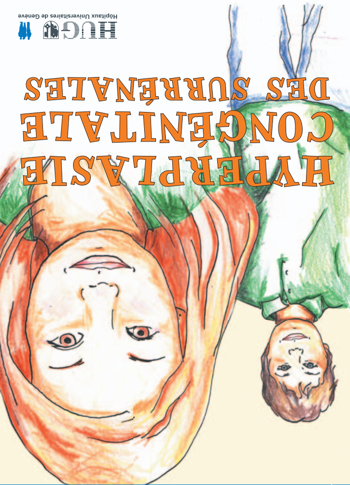
La carte qui t'explique ta maladie