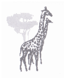
Girafe: de l'arabe "zarafa", douceur de vivre