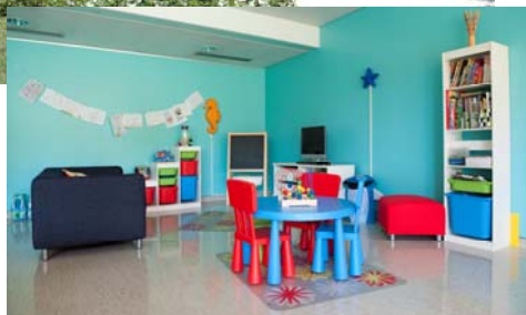
Un espace pour les enfants